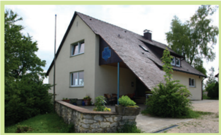
Eröffnung der Übernachtungshäuser

Die Ausführung erfolgt mit Betrieben aus der Region.