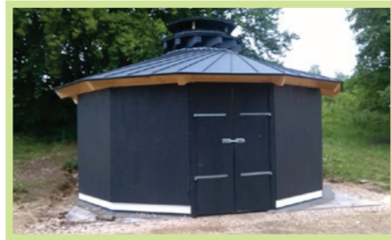
Bau von Kletterturm und Holzjurte