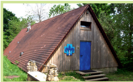
Bau der aktuellen Sanitärhäuser